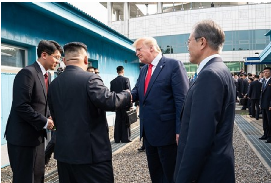
ภาพ 1 การพบปะกันระหว่างคิมจองอึน (Kim Jong-un) ผู้นำเกาหลีเหนือประธานาธิบดีมุนแจอิน (Moon Jae-in) ผู้นำเกาหลีใต้ และประธานาธิบดีโดนัลด์ ทรัมป์ (Donald Trump) ผู้นำสหรัฐอเมริกา ที่พื้นที่ปลอดทหาร

(demilitarized zone) ระหว่างเกาหลีทั้งสอง เมื่อวันที่ 30 มิถุนายน ค.ศ. 2019